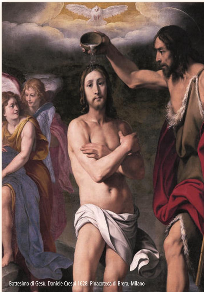
Battesimo di Gesù, Daniele Crespi 1628, Pinacoteca di Brera, Milano